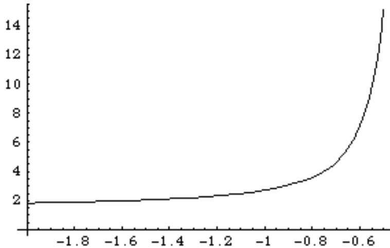
Figura 2: Grafico di y(t)

La soluzione deve essere una funzione di classe C^1 in un intervallo aperto contenente t_0 = -1 e risulta pertanto definita solo per t < 0 , quindi y(1) non esiste.