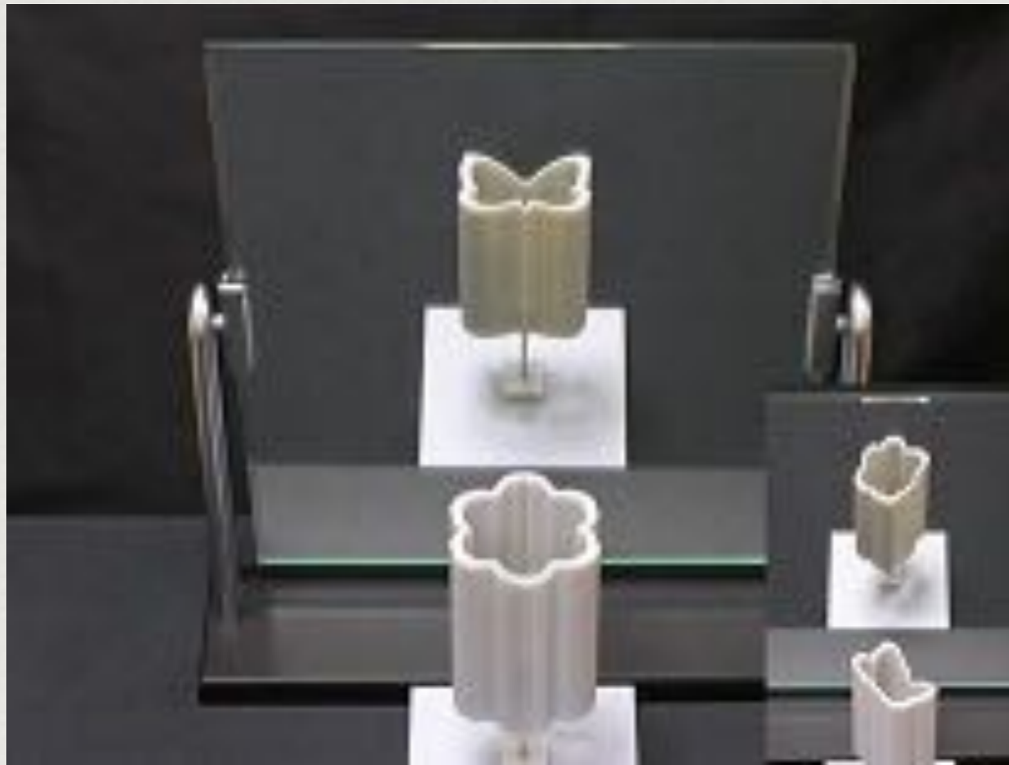
Opere di Kokichi Sugihara